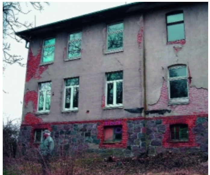
Der 150 Jahre alte Gutshof vor der Sanierung.

In der Summe bewirkt die energetische Verbesserung der Gebäudehülle über den Niedrigenergie-Standard hinaus eine Verringerung des Raumwärmebedarfs auf 28 %, bezogen auf einen vergleichbaren unsanierten Zustand. Grafik: energiebüro berlin