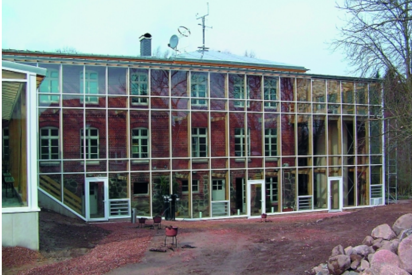
Glasvorbau - filigrane Außenstruktur.

die Zustimmung im Einzelfall benötigt, da noch keine allgemeine Zulassung vorliegt. Fenster und Außentüren bestehen aus Holz. Außen- und Dachflächenfenster des Seminarbereiches haben einen U-Wert von 0,8 \text{ W/m}^2\text{K} und sind damit passivhaustauglich. Sämtliche Fenster wurden ohne Montageschaum montiert und mit Flachfaser als Press- und als Stopfdichtung abgedichtet. Nur an der Außenkante der Abdichtung wurde ein vorkomprimiertes Dichtband eingesetzt. Die Fußböden wurden neu aufgebaut. Unter Estrich wurde mit Schaumglas 140 mm, unter Holzfußböden mit Zellulose 200 bis 300 mm gedämmt. Die Trittschalldämmungen bestehen aus Hanf-Schafwolle-Platten.