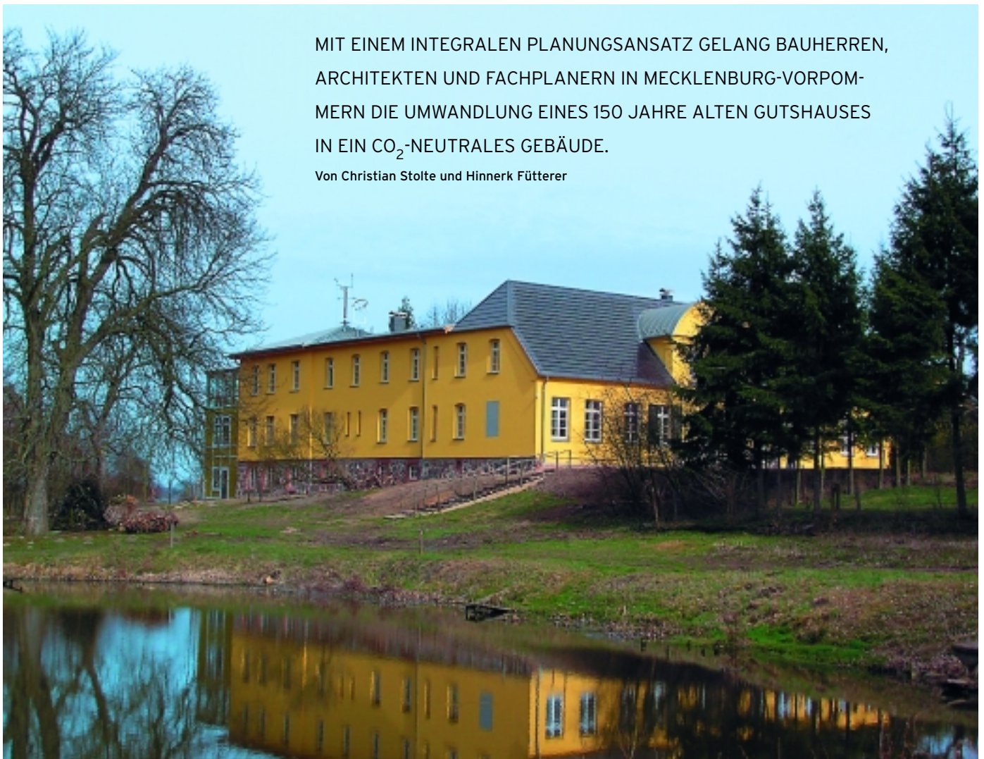
Der Gutshof nach der Sanierung. Er dient heute als Solarzentrum.

Von Christian Stolte und Hinnerk Fütterer